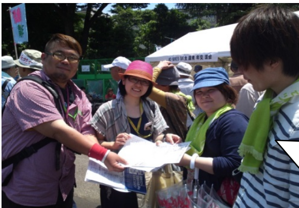
左2人が福島の青年。右が広島の青年。

原発事故「収束宣言」撤回署名へのご協力ありがとうございました！ 目標の200筆を大きく上回る 340筆 が集まりました。